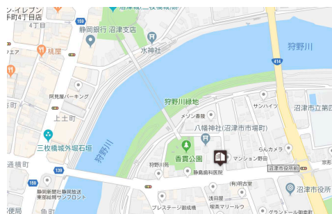
（中央公園内あゆみ橋を渡り、八幡神社参道入口東側）